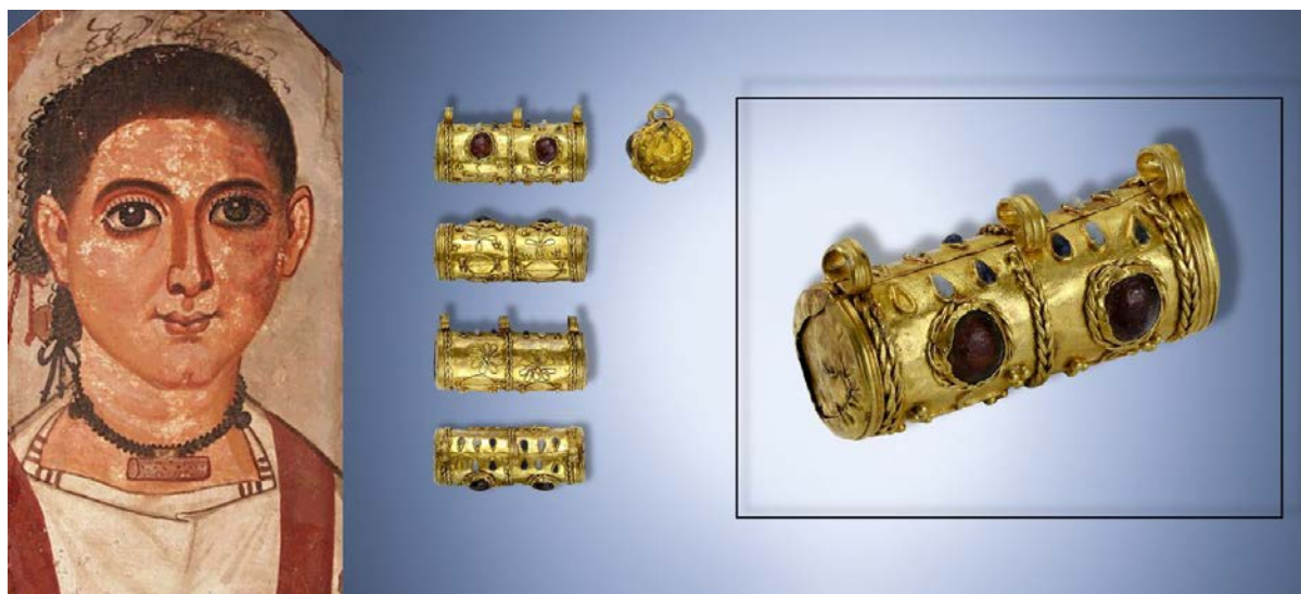
Слева: портрет мальчика из Эр-Рубаят, около 200 г. н.э. Дублин, Государственный музей Ирландии . В центре и справа: амулетница из некрополя Фронтвое-3

блюдах или рядом с наборами посуды за головой погребенного, указывают на появление нового типа обрядовой пищи в похоронном обряде.