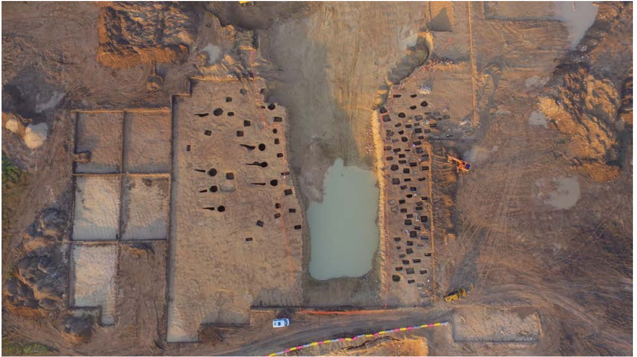
Могильник Фронтное 3. Вид сверху

Могильник Фронтное 3 был открыт и полностью исследован в 2018 году сотрудниками Крымской новостроечной археологической экспедицией Института археологии РАН. Памятник располагался на левом берегу реки Бельбек неподалеку от Севастополя и получил свое название по ближайшему населенному пункту – селу Фронтное. Археологи обнаружили в некрополе 332 погребальных сооружения, в которых было найдено около 20 тысяч предметов. Большинство погребений относится к римскому времени и могут быть датированы периодом от конца I до начала V века нашей эры.