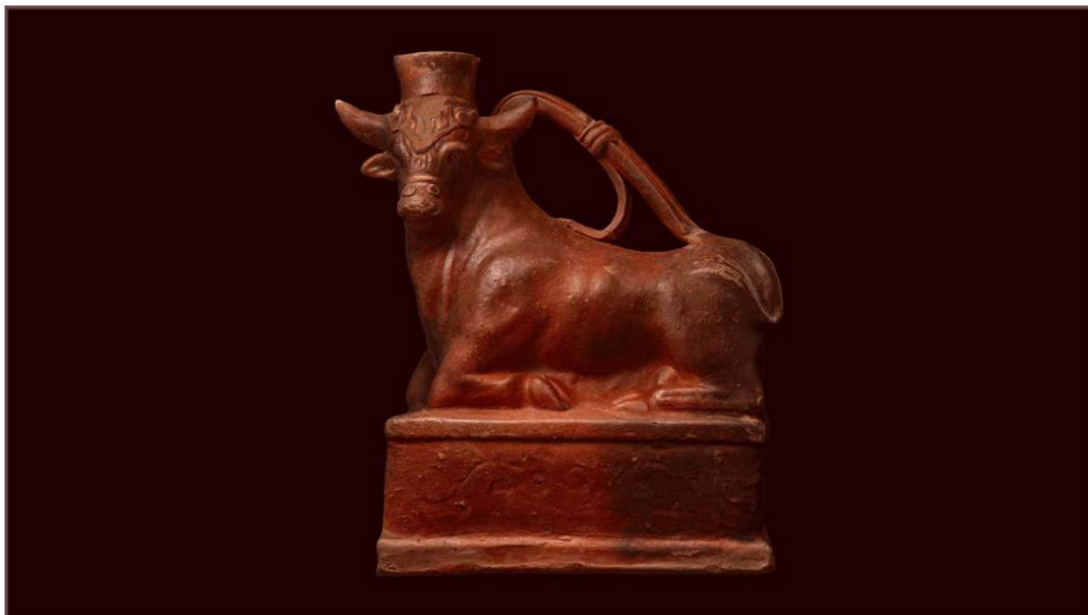
Керамический сосуд в виде быка. Конец I – первая половина II в.