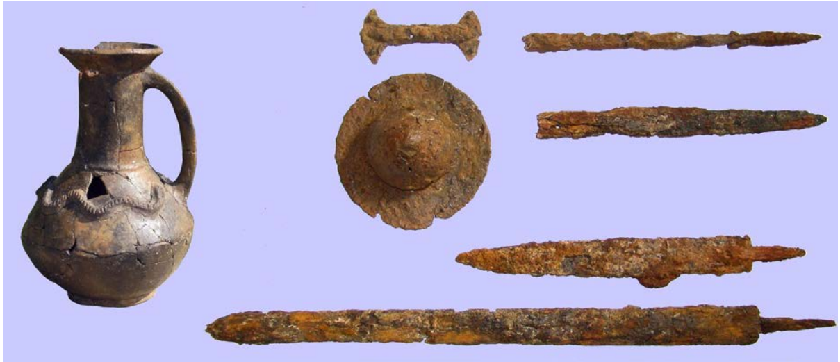
Находки из некрополя Сувлу-Кая: кувшин из погребения, оружие

В 2009 году в районе города Бахчисарай при проведении земляных работ был обнаружен некрополь III–V веков. На могильнике, получившем название Сувлу-Кая, сохранилось значительное количество непо потревоженных погребений периода с IV века по первую половину V века с выразительной архитектурой и специфическим набором погребального инвентаря: краснолаковыми, лепными, стеклянными сосудами, амфорами, украшениями и деталями костюма, орудиями труда, римскими монетами. Среди находок особый интерес представляют предметы вооружения (мечи, копья, наконечники стрел, детали щитов), некоторые из которых связаны с культурами германского круга и гуннскими древностями. Исследование ряда ярких погребальных комплексов позволяет уточнить представления о культуре населения начала Эпохи Великого переселения народов, которое, вероятно, впоследствии стало основой населения ранневизантийских крепостей Юго-Западного Крыма, называемого в письменных источниках «готами страны Дори».