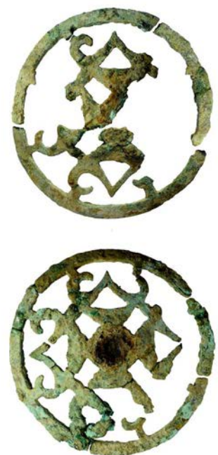
Слева: некрополь Фанагории. Погребение коня в процессе расчистки. Справа: ажурные колесовидные псалии из